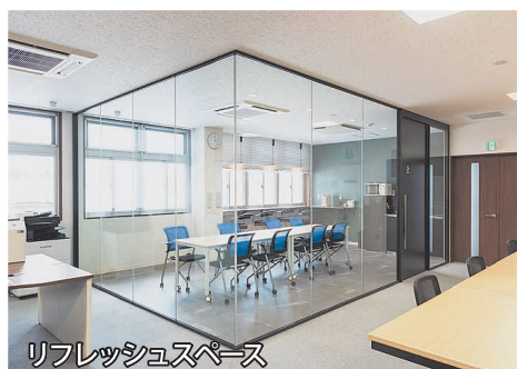
リフレッシュスペース